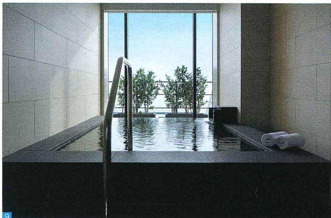
9.スイートルームには半露天風呂を完備。大きく面取られた窓とゆったりとした広さの源泉かけ流し湯が特徴で季節や天候にも左右されず、いつでも露天風呂の雰囲気が味わえる

夕食時、ハーバーランドを一望する窓際席の確約、乾杯ドリンク、お祝い3点セット、ミニブーケ、記念撮影、メッセージカードなど多岐なる特典付き。