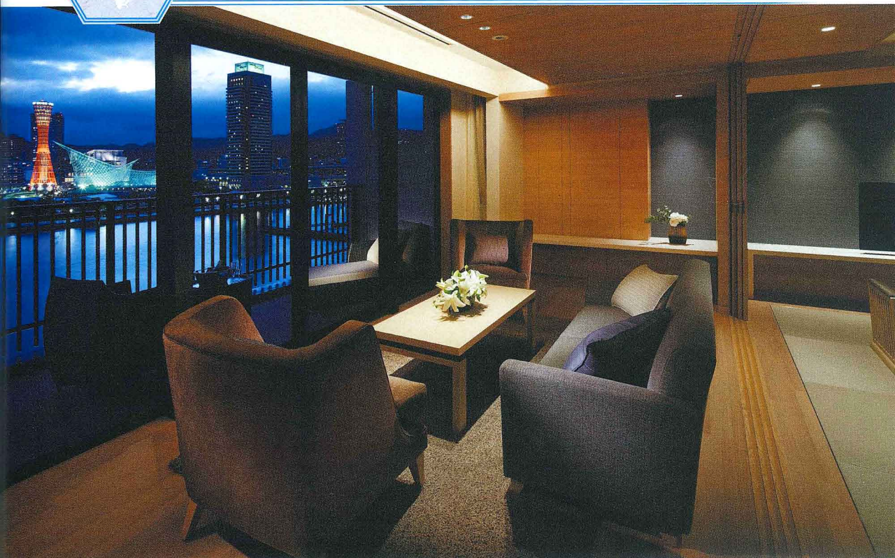
手の届きそうな距離に神戸の絶景を一望する「ハーバースイート」