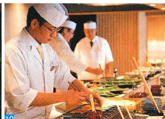
10 季節の山海の幸が並ぶライブブッフェ。握りたての鮓や揚げたての天婦羅、こだわりデザートやここでしか飲めない日本酒もある 11.展望バーは夜景を眺めながらお酒と会話を楽しめる、湯上りのひとときを満喫できる宿泊者限定の特等席