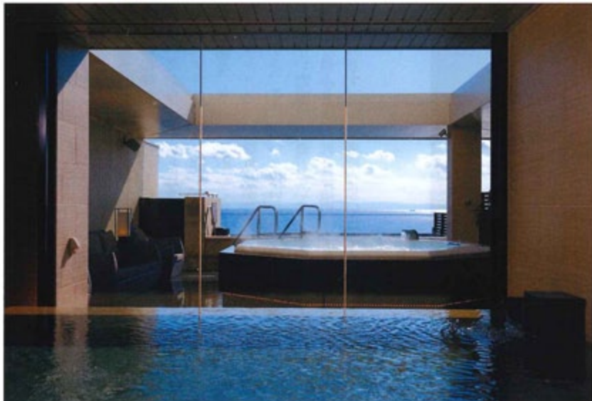
上・特別室は「ハーバースイート」、貴賓室は「オーシャンスイート」。どちらもベッドルームからの眺望も素敵。中・宿泊客専用の展望大浴場は10階に。露天風呂とジャグジーも併設されています。天気の良い日は、神戸空港や紀伊半島が一望できます。1階にある屋内・露天大浴場も利用可能。