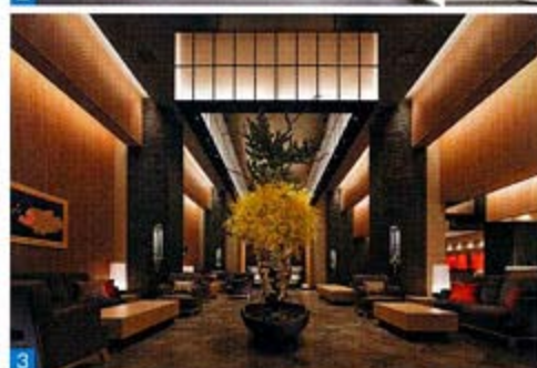
1.270°海に囲まれた抜群のロケーション 2.全室テラスを含め60㎡以上の広さを誇る。12室あるスイートルームには源泉かけ流し風呂を備える 3.館内は洗練された雰囲気と和の風情が調和する和モダンの空間

神戸の中心地にありながら、海に囲まれた絶好のロケーションを誇る天然温泉旅館。客室は270度を海に囲まれた抜群のロケーションを生かし、全室オーシャンビューテラスを備えた60㎡以上の和洋室タイプ。スイートルームは全室角部屋で、神戸港の雄大な景色を一望する源泉かけ流しの展望半露天温泉を配した上質な施設だ。地下1150mから湧出する源泉を使用し、日帰り天然温泉も備えている。夕食は季節の山海の幸をふんだんに使用した約60品目の料理が味わえるブッフエステイル。揚げたての天婦羅や、目の前で握る寿司、ローストビーフは絶品だ。また、季節会席や特選神戸牛しゃぶしゃぶなど、夕食を自室でいただけるスイートルーム限定プランも人気。また、岩盤浴・溶岩浴・混浴温水プールなど、多彩な施設も魅力的。ぜひ、たくさんの時間が楽しめる温泉旅館だ。