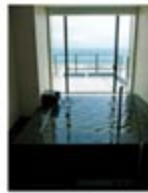
スイートルームには大きな窓のある半露天の源泉掛け流し温泉を完備。流石の湯を独り占め。

さらに美しくなるために…… 朝食の漢方薬膳粥で内側から体質改善 ライブ割烹「万葉」の朝食は、光沢した和風メニュー。そのなかでもお粥めなものは漢方薬膳粥。紅花、タコノ実、百首煎、白米などといった漢方を、好みでお粥に混ぜていたが、疲労回復や美肌作りなど、日々の健康がある漢方を朝に食すことで、体質が整うのだ。