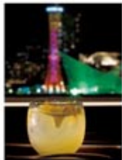
きらめく夜景を眺めながら飲むお酒は格別。最上階の『麗望BAR REN KOBE』。17時〜24時

します。今の時季なら、プールサイドでお酒を楽しめる貴重な時間を過ごすのも素敵です」とホテルのスタッフは目を細めます。「ふだんとは考えられない時間を堪能してほしいです。お楽しみ夕食は、山海の幸をふんだんに使った60種の料理が並ぶビュッフェ。総料理長がとりわけ力を入れるのは、寿司や天ぷらを、注文に応じて目の前で調理するライブ感たっぷりの割烹コーナーです。出来立ての夕食を味わったあとは、展望バーへビールやワイン、カクテルも豊富に揃いますが、さっぱりとした特製のレモネードもおすすめです。朝のビュッフェには、漢方薬膳粥をはじめ、香り高い高山烏龍茶などが並び、どこまでも体思い。毎週でも通いたくなります。