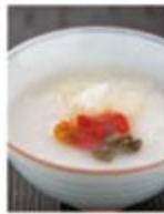
作りたてのお粥はとろりととろぬめり、トッピングした漢方は味や食感が異なり、食が進む。

さらに美しくなるために…… 朝食の漢方薬膳粥で内側から体質改善 ライブ割烹「万葉」の朝食は、光沢した和風メニュー。そのなかでもお粥めなものは漢方薬膳粥。紅花、タコノ実、百首煎、白米などといった漢方を、好みでお粥に混ぜていたが、疲労回復や美肌作りなど、日々の健康がある漢方を朝に食すことで、体質が整うのだ。