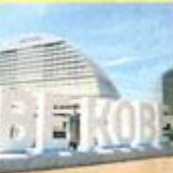
海を背景に写真が撮れると、観光客が 많아 増えている。夏真っ盛りになり、アートを撮る楽しみも増える。

神戸の魅力を世界に発信! 阪神・淡路大震災から20年をきっかけに「神戸の魅力は人である」という思いを込めたメッセージとして17年に設置された「BE KOBE」のコミュニケーション、ここでは人気の観光スポットに、 ①神戸市中央区東灘区 11:30-18:00、ディナー17:00-21:30(最終入客30分前) 10名以上 ¥3,300、30名様 ¥4,300(税別) 10名以上 ¥2,940(税別) 神戸駅前駅より徒歩15分(三宮駅より無料シャトルバスあり)