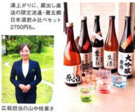
湯上がりには、蔵出し直送の限定流通・灘五郷日本酒飲み比べセット2750円も。