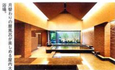
月替わりの唐風呂が楽しめる屋内大浴場。