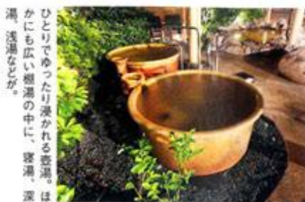
ひとりでゆったり浸かれる壺湯。ほかにも広い棚湯の中に、空湯、深湯、浅湯などが。