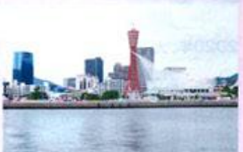
神戸ポートタワーや神戸海洋博物館がすぐ目の前。夕景から夜景へと変わりゆく時間もおすすめ。

新港第一突堤を掘削し、地下1150mから湧き出した自家源泉を「神戸みなと温泉」と命名、2015年に開湯。塩化ナトリウム(食塩)と炭酸水素ナトリウム(重曹)をたっぷり含み、保温効果が高く、湯上がりのつややかな肌に海のパワーを感じる。