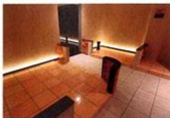
8タイプの岩盤浴と溶岩浴が体験できる「八蓮花」(午後11時まで、別途1100円)。ホットヨガのプログラムも人気。