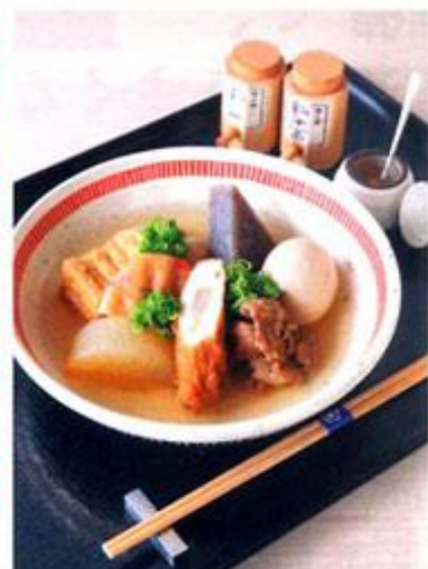
鶏ガラや背脂、野菜からだしをとる料理長こだわりの風味豊かなおでんもおすすめ。8種盛り合わせ1100円。