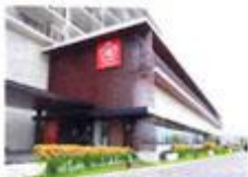
専用無料シャトルバスを降りるとすぐに日帰り入浴専用エントランスが。

屋外温水プール「オーシャンズスパ」(別途2200円)。ボードを使って行うSUPヨガのレッスンは女性に人気。