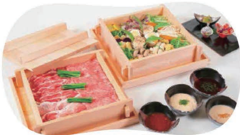
兵庫三昧せいろ蒸し