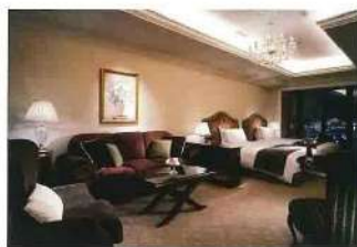
日常を忘れてしまう高級で贅沢な空間。クチコミランキングでも1位になった人気のホテル

山と海に挟まれた神戸の街は決して広いとはいえない。これは街としての魅力がコンパクトに凝縮されていて、観光がしやすいということ。実際に三宮を中心とした市街地には数多くの観光スポットや飲食店が集まっており、徒歩でまわるのも難しくない。一泊二日の日程でも神戸の魅力は味わえそう。この3月に新たにフジドリームエアラインズ（FDA）が新潟—神戸線を就航したので、行ってみることにした。 16時50分に新潟空港を出発し、神戸に到着するのは18時10分。地方空港の多くは市街地までのアクセスに時間が取られるのがネック。しかし神戸の場合、空港から市街地まではポートライナーに乗ってわずか18分で着く。 神戸といえば夜景が有名。代表的なスポットがメリケンパークの神戸ポータルタワーだが、残念ながら来夏まで改修工事中。現在はタワーを包んだシートに夜、プロジェクトションマッピングが映し出されている。その迫力と美しさは思わす息をのむほど。到着1時間足らずで、すでに神戸の魅力にぐっと心をつかまれた。宿泊は神戸っ子に人気の『ホテルラ・スイート神戸ハーバーランド』。ここからも神戸の夜景が存分に楽しめるのだ。