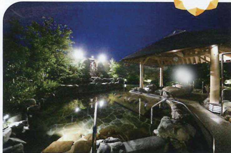
源泉かけ流し湯や壺湯が楽しめる屋外露天大浴場