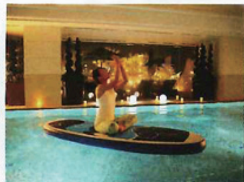
左/アロマの香りが漂う岩盤浴と溶岩浴施設「八蓮花」 右/ SUP ヨガのレッスンも (2,970円)