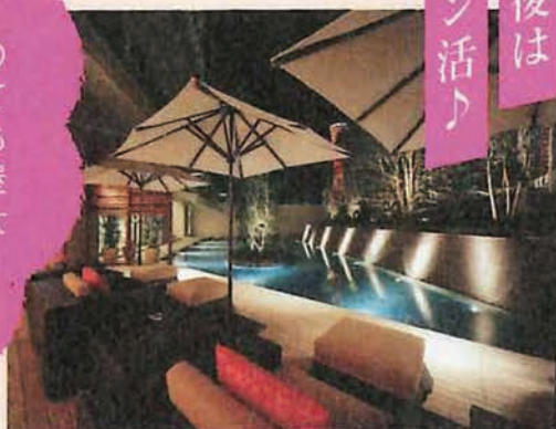
光と水、音が演出する女性専用サロン。ラウンジにはフリードリンクも

チェックインやチェックアウトの際、スタッフの方が笑顔で対応してくださり、最初から最後まで気持ちよく過ごす事が出来ました。お部屋や部屋からの眺めも素敵でした。女性専用スパでは癒されました。 (女性40代 / 2022年7月宿泊)