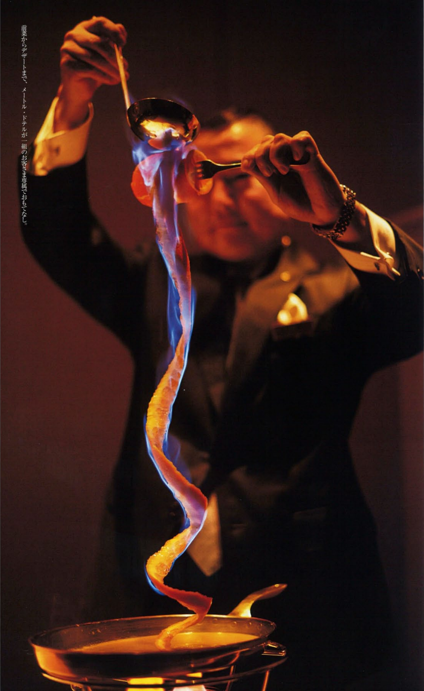
前菜からデザートまで、メートル・ドテルが一組のお客さま専断でおもてなし。

異国情緒漂う建物と、海と山がつくり出す港町の風景。ファッションの街、洗練されたライフスタイルを持つ街、神戸。その趣や魅力を凝縮したのが「ホテル ラ・スイート神戸ハーバーランド」。世界のトップホテルだけが加盟できる「スモール・ラグジュアリー・ホテルズ・オブ・ザ・ワールド」に日本のホテルとして初めて迎えられ、「ミシュランガイド関西2014」でも四年連続、神戸最高評価を獲得した、オープン五年目にして注目を集めるホテルです。