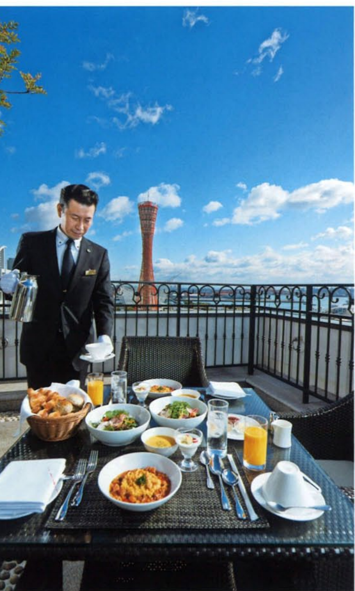
旅行サイトで日本一に選ばれた洋朝食の卵料理やサラダは兵庫の食材をふんだんに使用。天気の良い日は客室のテラスでもいただけます。

女性たちやリピーターを虜にしているのは、広々とした客室や全客室完備のジャグジーだけでなく、テラスから見える美しい景色。夕暮れから夜にかけては街の灯り、朝は暖かな日の光に包まれます。さらにホテルステイを極上にくれるのが「美食」。おもてなしのエキスパートであるメートル・ドテルが目前で華麗にサービスを行う、一日一組限定のスペシャルカービングディナー。また、「日本一の朝ごはん」を決める大会において一位になった洋朝食は、総料理長自らが約二〇〇軒を訪ね、構築したネットワークから届く新鮮な兵庫の食材をお楽しみいただけます。