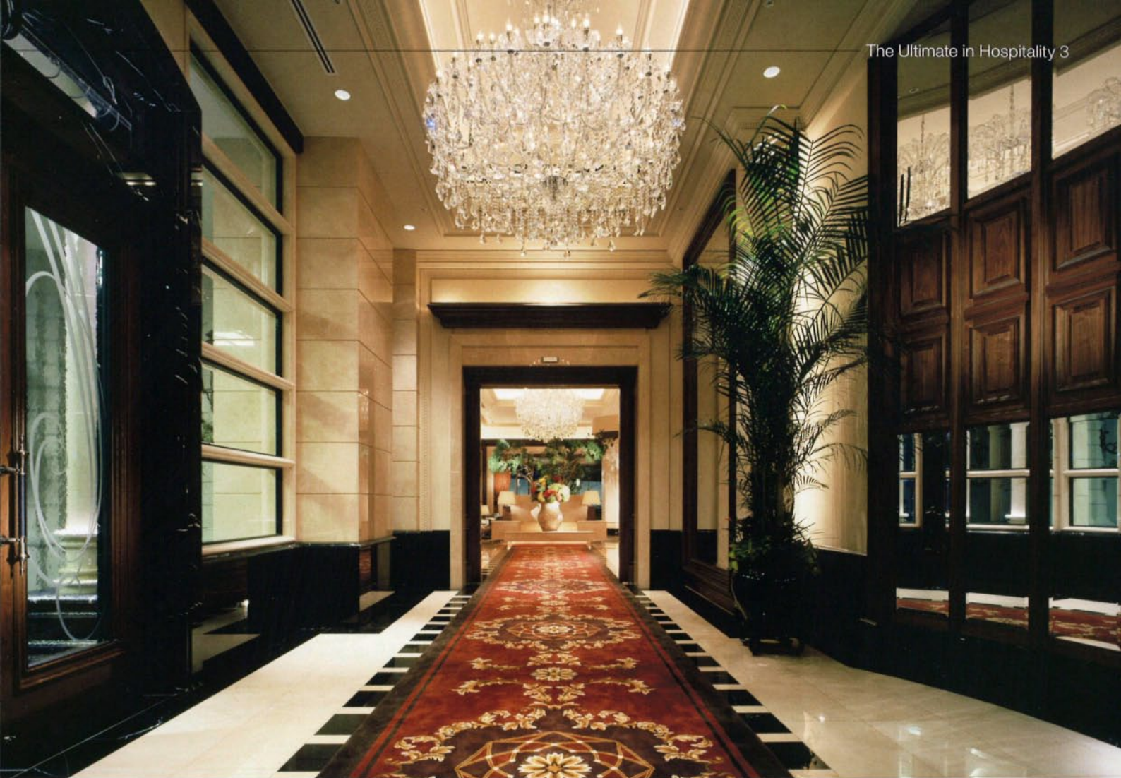
シックで落ち着いた雰囲気のリビー。温かくゲストを迎えてくれる(上)。モダンとクラシックが溶け合う「ラグジュアリー スーベリア」の客室(下)。