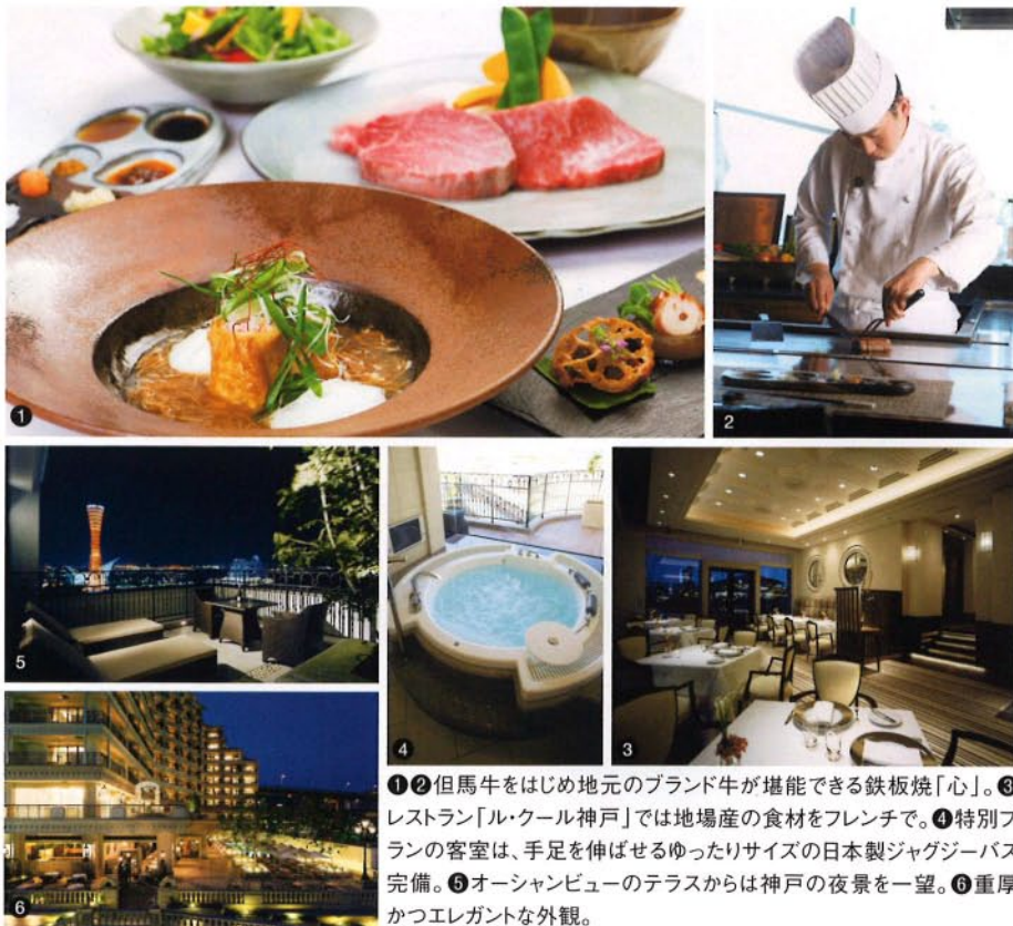
①②但馬牛をはじめ地元のブランド牛が堪能できる鉄板焼「心」。③ レストラン「ル・クール神戸」では地場産の食材をフレンチで。④特別 プランの客室は、手足を伸ばせるゆったりサイズの日本製ジャグジーバス 完備。⑤オーシャンビューのテラスからは神戸の夜景を一望。⑥重厚 かつエレガントな外観。