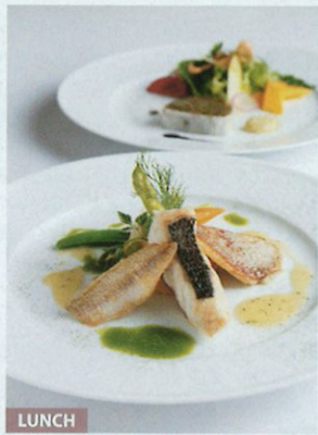
LUNCH 兵庫食材の地産地消フレンチ。淡路島、丹波や但馬などの食材を取り入れる地産地消がコンセプトのフレンチレストランでのランチorルームサービス

隣がポートタワーという神戸ならではのロケーションに、全室クラブフロア仕様のゴージャスなシテイリゾート。11月にオープン1周年を迎えるこちらで、憧れのエステを日帰り堪能できるプランが本誌限定で登場！朝7時半から入れるスパでじっくり体を温めたら、フランスやドイツの有名ブランドでそろえたトリートメントの中から、全身リラックスマッサージや経絡マッサージなどの60分のコースを選んで極上のリラックスタイムを。地産地消のフレンチを味わい、ジャクジー付きの部屋で17時までゆったり過ごす、夢のような贅沢三昧が実現します。