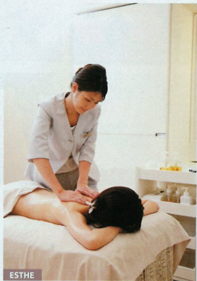
ESTHE スパと極上トリートメントの相乗効果。女性専用スパゾーンで小一時間、体を温めてからフィット、アロマ、タラソを融合したスキンケアを

客室に備えられたジャクジー。キャロル・フランクのアロマオイルをはじめアメニティもフランスの高級ブランドを使用