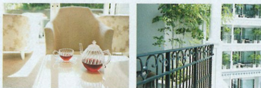
左・トリートメント後に温かいハーブティーやエルダーフラワーの冷たいドリンクなどを。右・客室のバルコニーは見晴らし抜群