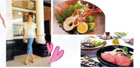
【鉄板焼 心】神戸市中央区波止場町 7-2 ホテル ラ・スイート神戸ハーバーランド 2F TEL: 0066-9674-08999 (予約専用番号・通話料無料) 078-371-6644 (お問合せ専用番号) 定休日: 無休 (全館貸切、イベント時を除く) 営業時間 11:30 ~ 15:00 (L.O.14:00) 17:30 ~ 22:30 (L.O.21:00)

神戸港のオーシャンビューが楽しめる鉄板焼☆ ホテル ラ・スイート内にある鉄板焼 心♡カウンターに座ると、 これぞ神戸なオーシャンビューが飛び込んでくる最高のロケー ション♡神戸牛をはじめ、創造性豊かなメニューが揃います♪