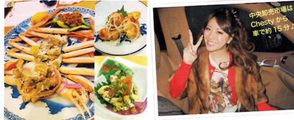
【寿司料理 まるも】神戸市兵庫区中之島 1-1-4 中央卸売市場飲食店街 2F TEL: 078-671-3555 定休日: 日曜・祝日 営業時間 11:00 ~ 14:30 17:00 ~ 20:30

とにかく新鮮♡中央卸売市場内にあるお寿司屋さん 神戸の中心部から少し西側に、中央卸売市場があります♪市場前 にあるお寿司屋さん、まるもでは、新鮮なお魚を堪能出来ます☆ ピンクタグが着いた築山港の松葉蟹など、産地にこだわりアリ♡