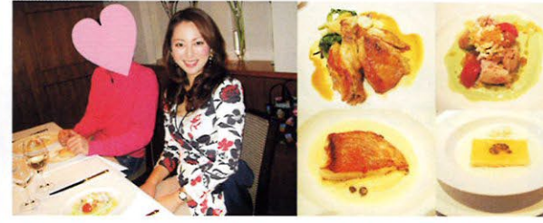
【Patous】神戸市中央区中山手通 3-5-10 サンシャイン中山手 1F TEL: 078-392-8216 定休日: 火曜日 営業時間 11:30 ~ 14:00 (L.O) 18:00 ~ 21:00 (L.O)

記念日におすすめ♡神戸らしさを堪能出来るフレンチ・フレンチ シンプルでいて、洗練されたセンスの良さを感じるフレンチ・フレンチ パトゥ♡ おもてなしの心を感じる温かな雰囲気の中、素材を活かしたお料理をゆったり 堪能することが出来ます♡大切な人と訪れたい、神戸らしさを感じる名店です♪