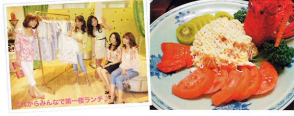
【第一樓】神戸市中央区江戸町 94 TEL: 078-331-0031 定休日: 無休 営業時間 (平日) 11:30 ~ 15:00 (L.O) 14:00 17:00 ~ 21:00 (L.O 20:00) (土日祝) 11:30 ~ 21:00 (L.O 20:00)

半世紀にわたって愛される老舗☆第一樓の芸術的中華 Chestyオンラインショップのすぐ近くに建つ、神戸を代表する老舗高級中華、第一樓☆ "大切な人をもてなすための料理"として知られる北京料理は、どれも芸術品の ような美しさ♡蒸し鶏やフカヒシ、ロブスターに鮑など、高級食材を堪能出来ます♪