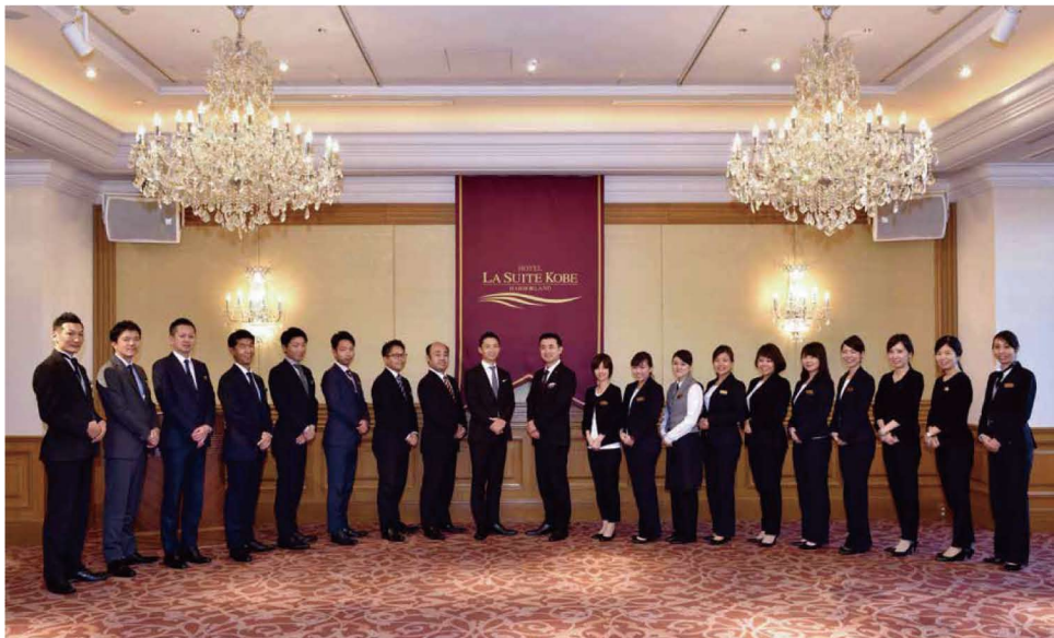
宴会部門の皆さん。コミュニケーションを深めながら総合力を強化