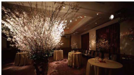
すべてにこだわったクオリティーを重視